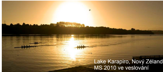
Lake Karapiro, Nový Zéland MS 2010 ve veslování