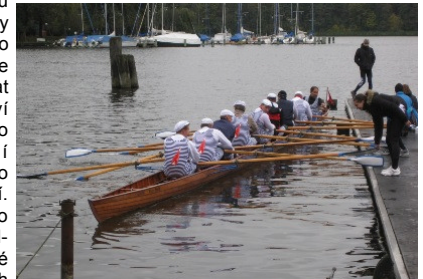
Párová osmiveslice smíchovských veteránů na závodech v Berlíně

Vedení VK Smíchov děkuje všem svým členům za reprezentaci na šeho klubu a všem, kteří podpořili v roce 2009 náš klub v jeho činnosti. Českému veslařskému svazu a zvláště společností Zakládání group a.s., TERRACON a.s., DOKA a.s. a společnosti VEPA. Hodně sportovních úspěchů v roce 2010.