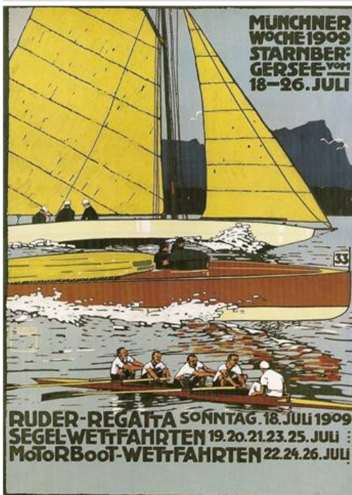
Plakát veslařské regaty pořádané v Mnichově v roce 1909